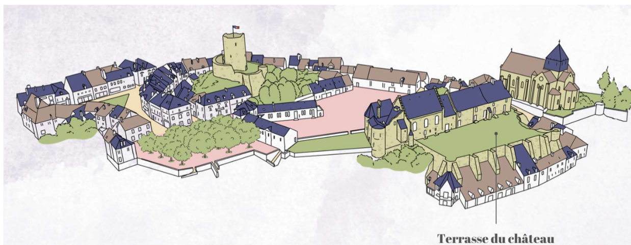
Terrasse du château

Cette intervention a ouvert la voie à une valorisation plus large du site, avec l'aménagement et l'ouverture au public d'un espace jusqu'ici inaccessible.